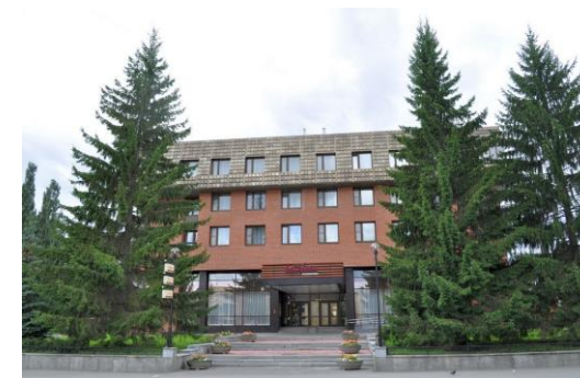
Софьи Ковалевской, 17